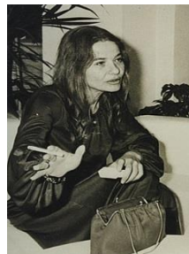
Töröcsik Mari, Cannes 1976

Töröcsik Mari ünnepi ruhája, melyben a Cannes-i Nemzetközi Filmfesztivál legjobb női alakításáért járó díjat vette át 1976-ban.